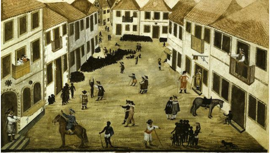
Mauritsstad - Slavenhandel in ruil voor suiker, Zach. Wagner, 1634.

De reis begon in een van de vele Nederlandse havens. De VOC bracht vanuit Azië, als retourvracht regelmatig Kaurischelpen mee, die weer werden gebruikt als betaalmiddel voor de slavenhandel. Vanuit Nederland voeren de WIC-schepen naar één van de Nederlandse forten aan de Afrikaanse Goudkust, de belangrijkste waren Elmina en Accra. Betaling, bij aankoop in Afrika, werd ook gedaan met Provinciaal goud en zilvergeld, Spaanse zilveren reaalstukken en goederen uit Europa.