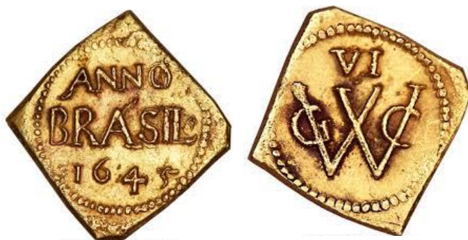
Brazilië, GWC, gouden dukaat van 6 gulden, ANNO 1645

Spanje bood de republiek vrede aan, onder ook de voorwaarde dat deze zich zou terug trekken uit de vaart op Azië en Amerika. Uiteraard werd hierop negatief gereageerd door de Republiek. De VOC was begin 17 e eeuw opgericht en met hulp van de Britten lukte het steeds vaker om de monopoliepositie van de Spanjaarden en Portugezen in Azië te doorbreken en sterk te verzwakken. Door het 12-Jarig Bestand, tijdens de Tachtigjarige oorlog (1609-1621), werd de handel met 'de West' opgeschort, waardoor de aanvoer van zout, suiker en tabak vanuit de Caraïben stagneerde. Er werd dan ook veelvuldig onder vreemde vlag gevaren om nog een beperkte aanvoer naar de Nederlanden te kunnen behouden.